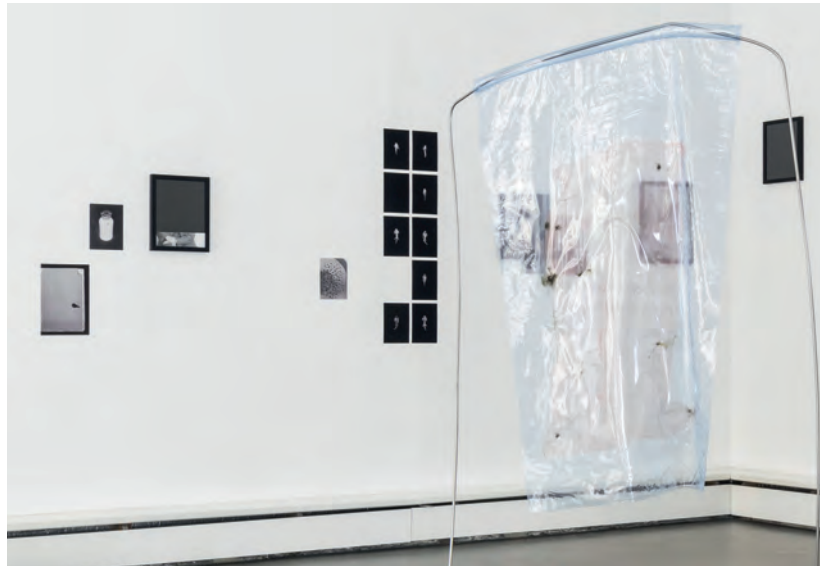
Klassenausstellung / Bildraum 01 Beyond Deviation, 2019